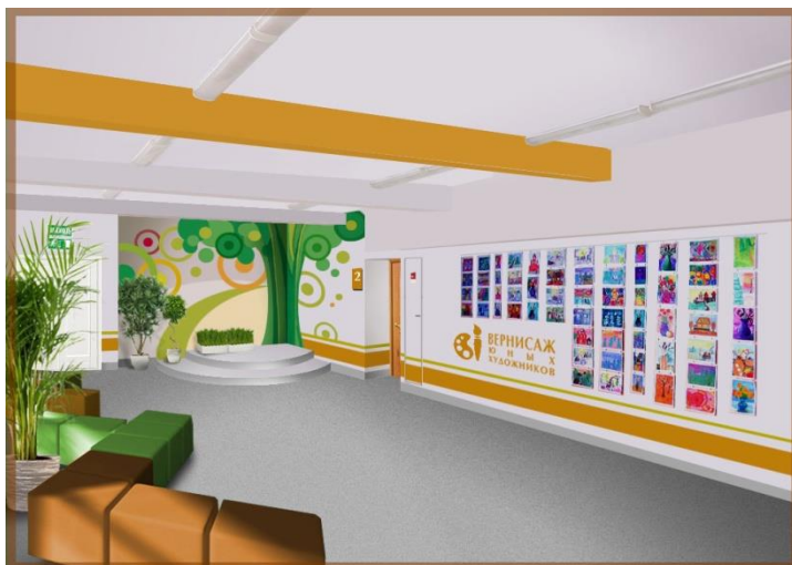
Рисунок 1. Левый холл: «Вернисаж юных художников».

В номинации «Обустройство внутреннего пространства помещения» победителями и призерами стали: